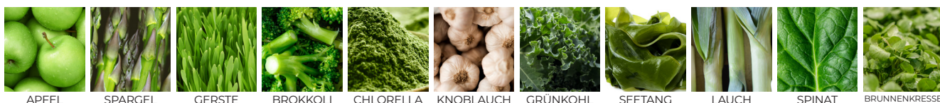
APFEL SPARGEL GERSTE BROKKOLI CHLORELLA KNOBLAUCH GRÜNKOHL SEETANG LAUCH SPINAT BRUNNENKRESSE